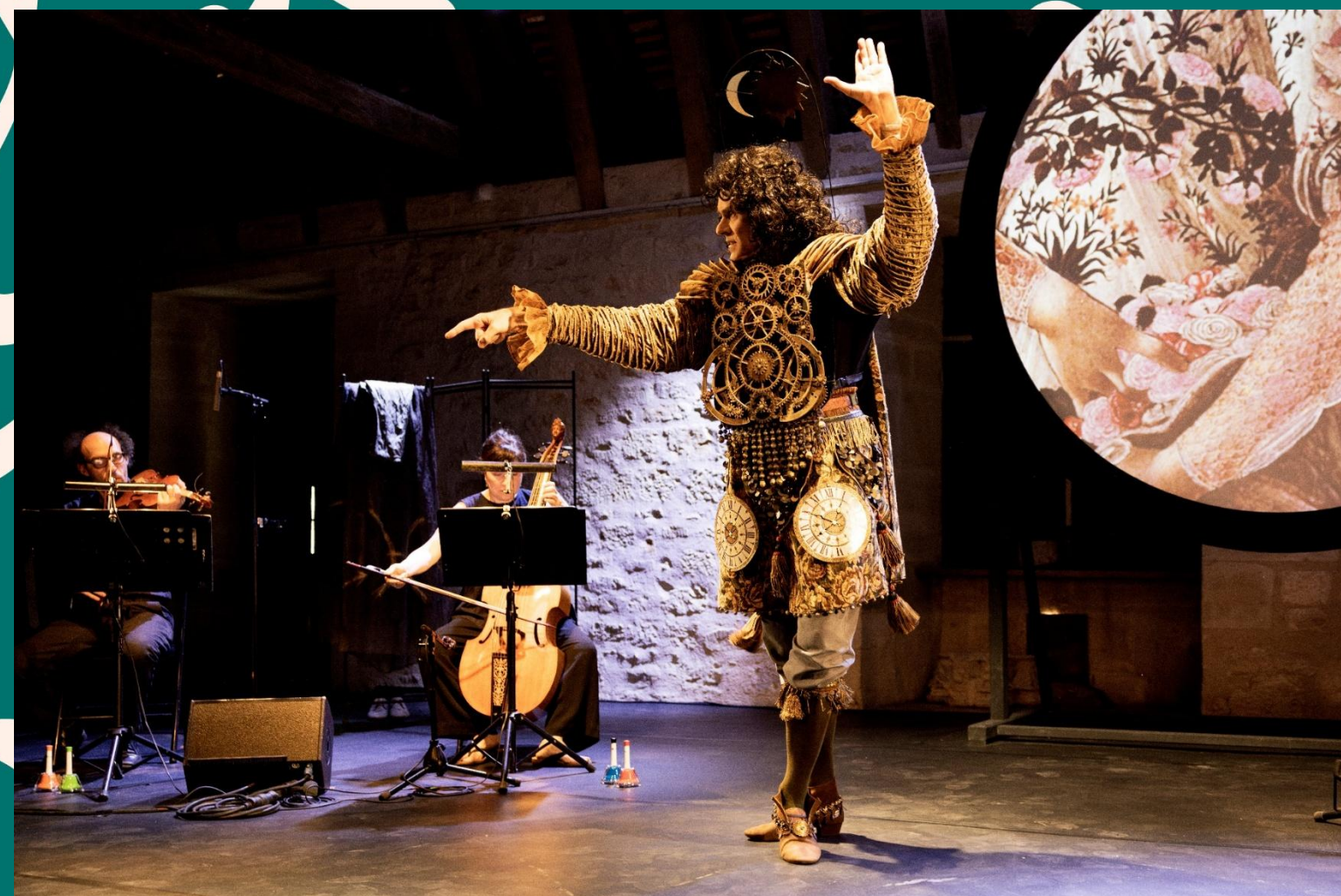
Tempus Fugit © Nadège Le Lezec