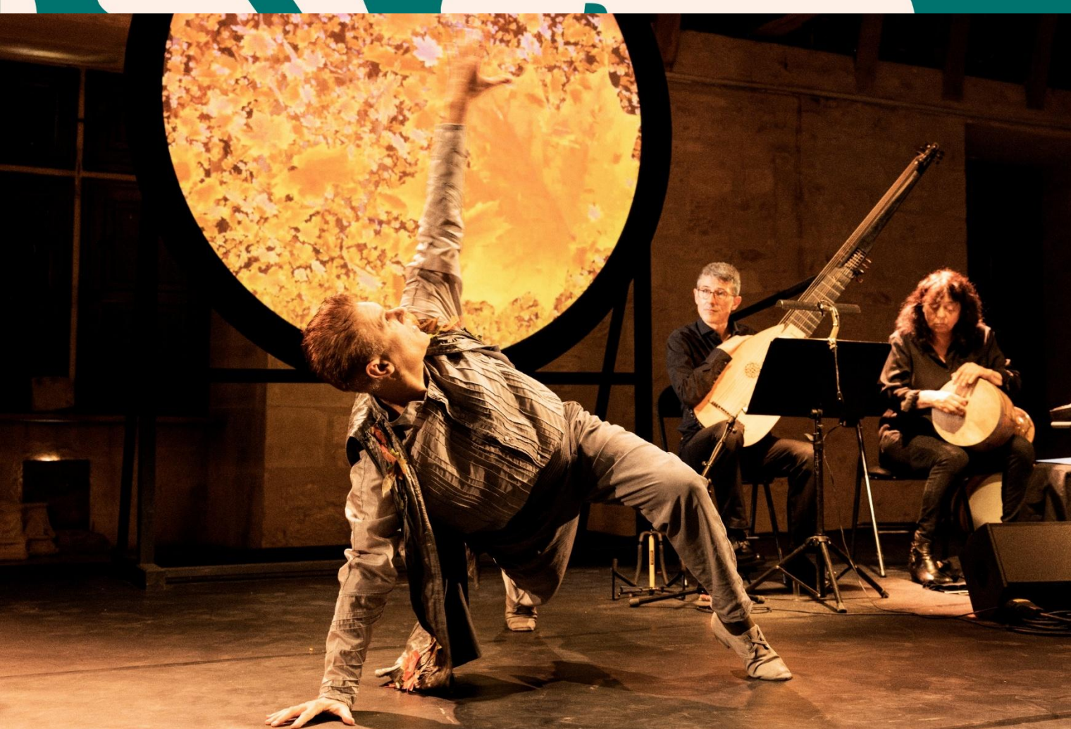
Tempus Fugit