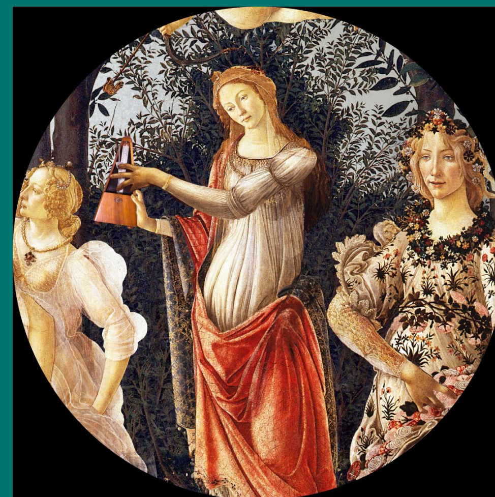
Tempus Fugit