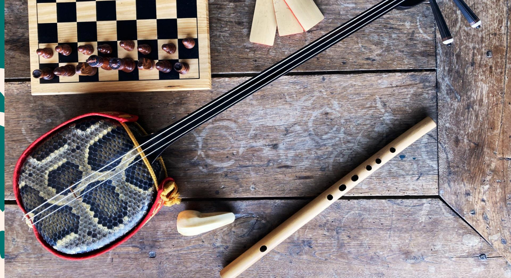
Sanchin, fue et castagnettes japonaises dans une nature morte à l'échiquier