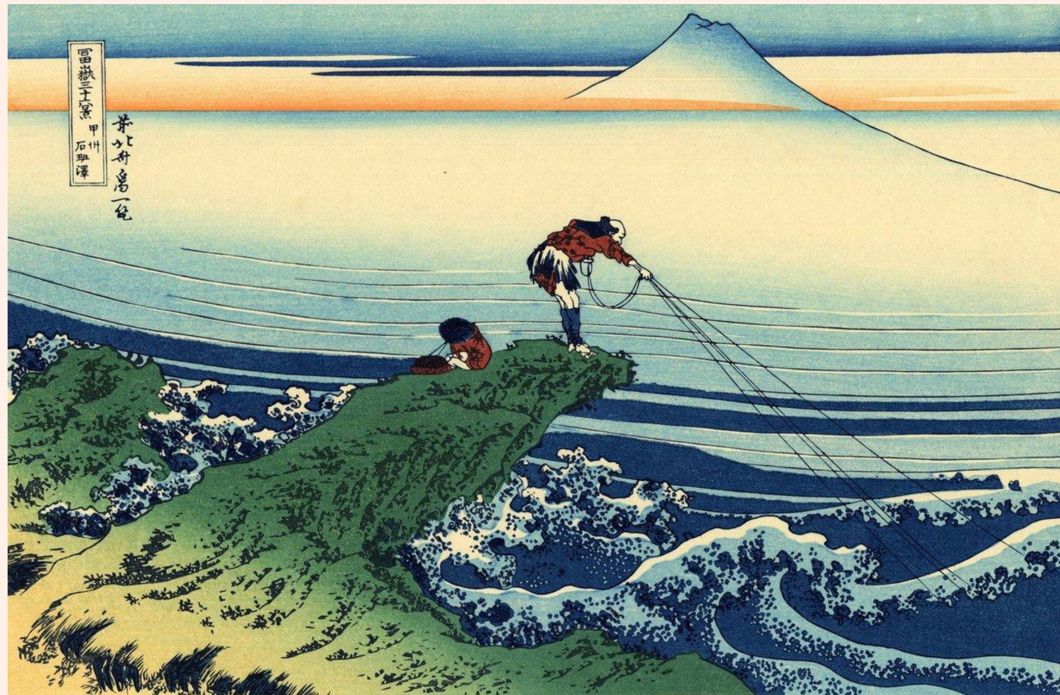
Hokusai, 36 vues du mont Fuji

Conception graphique | Gallia Vallet (Cie Les Rémouleurs)