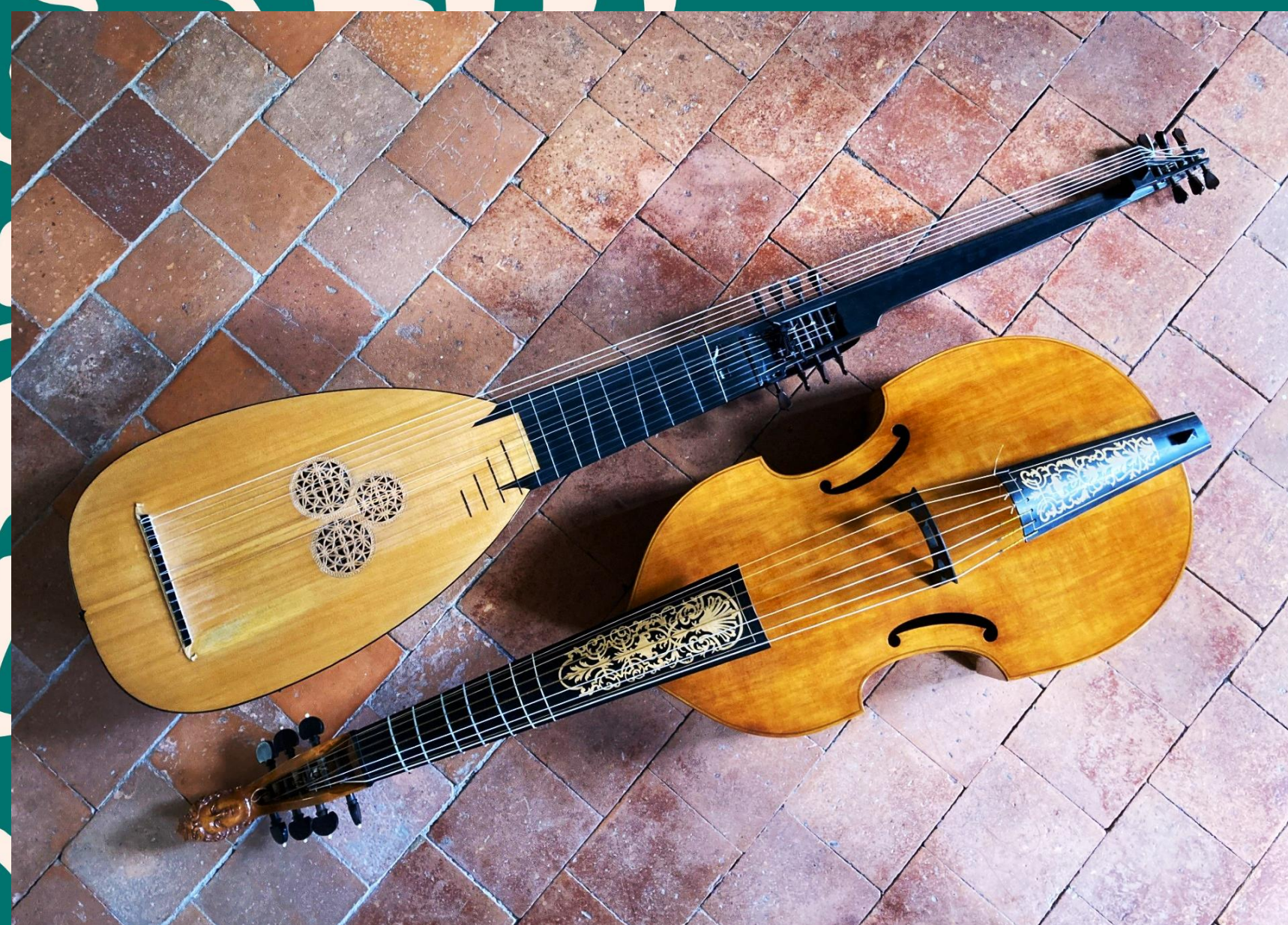
Théorbe et viole de gambe