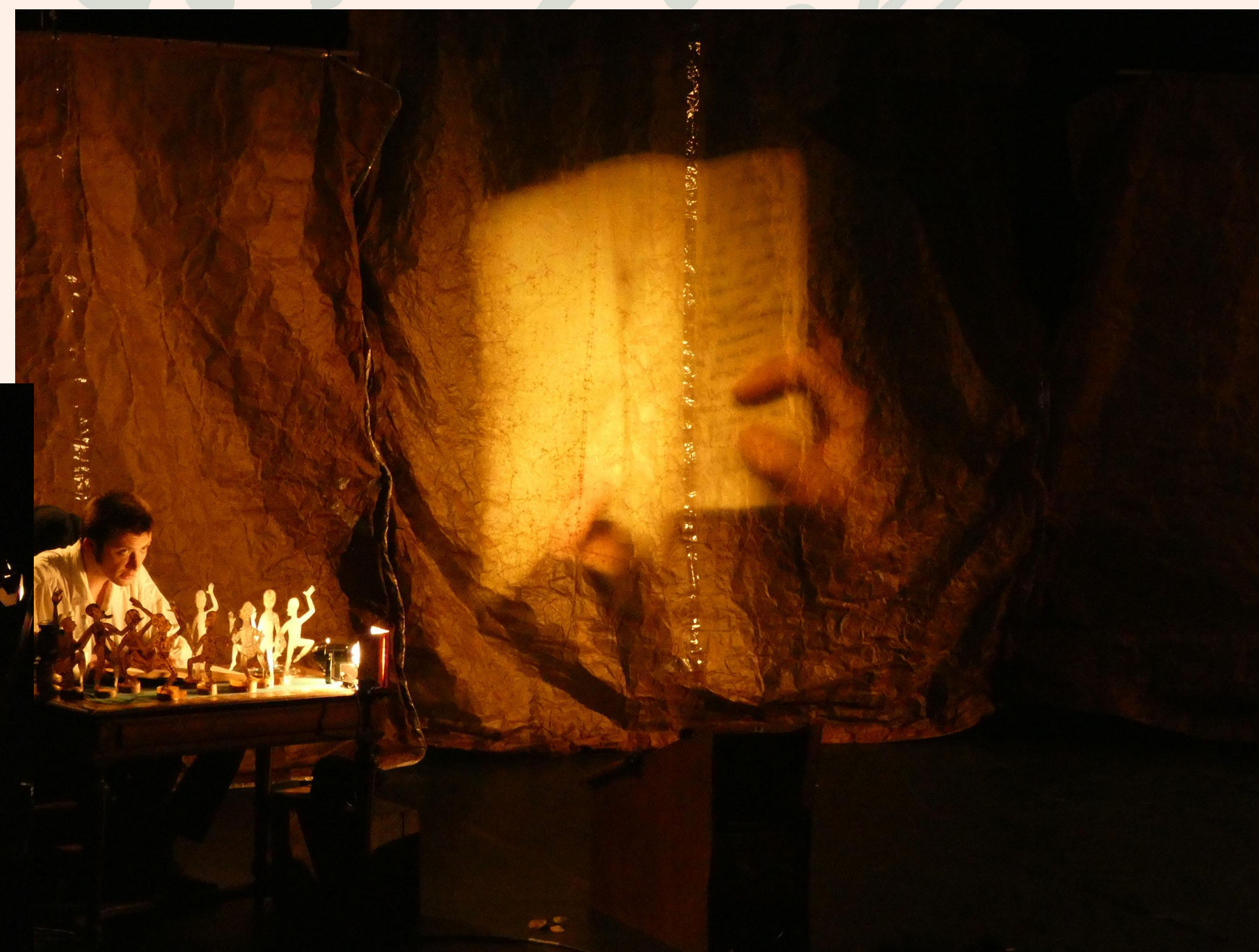
Les Derniers Géants (© Compagnie Les Rémouleurs)