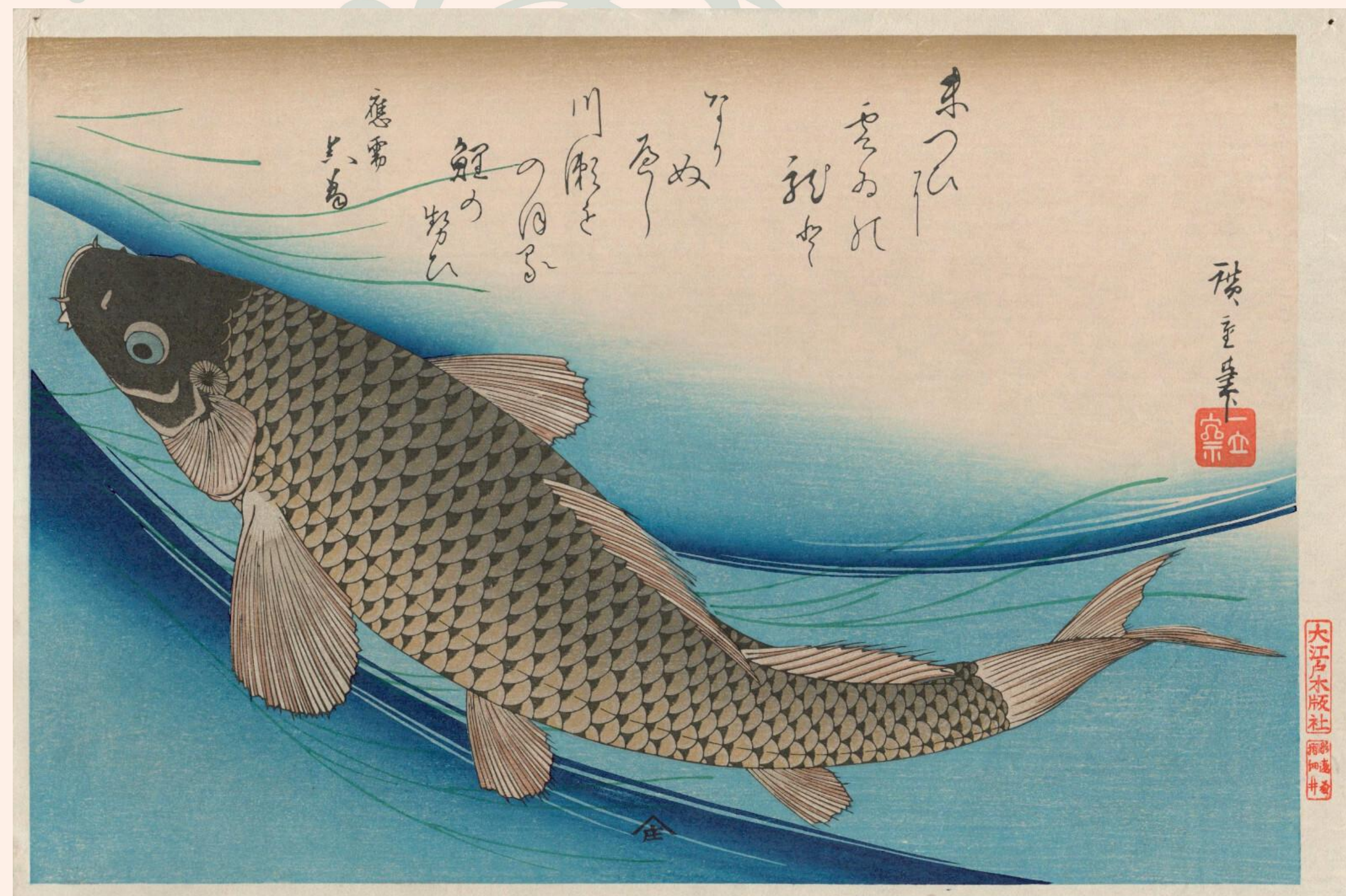
Koi (carpe) (Hiroshige, estampe de la série Uozukushi, ca. 1830/1840)

L'eau, qui a inspiré tant d'artistes hier, est enfin un enjeu majeur pour notre société de demain et un bien précieux qu'il faut préserver.