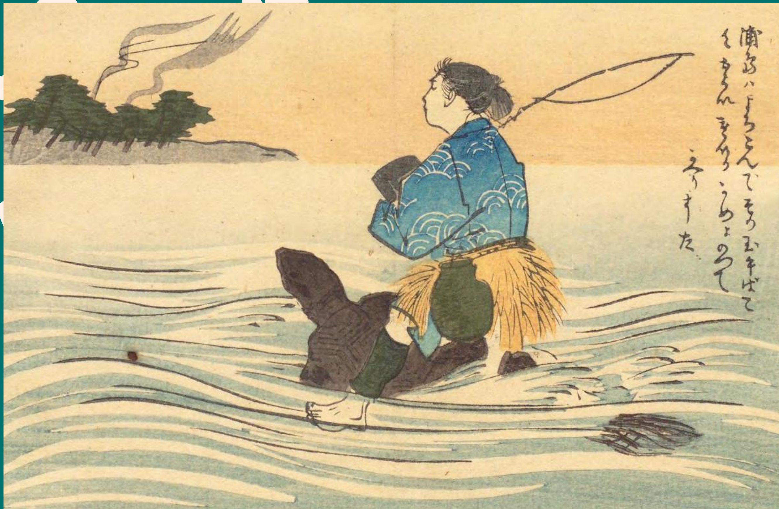
Urashima rentre chez lui sur le dos de la tortue, Matsushita Heikichi, 1899