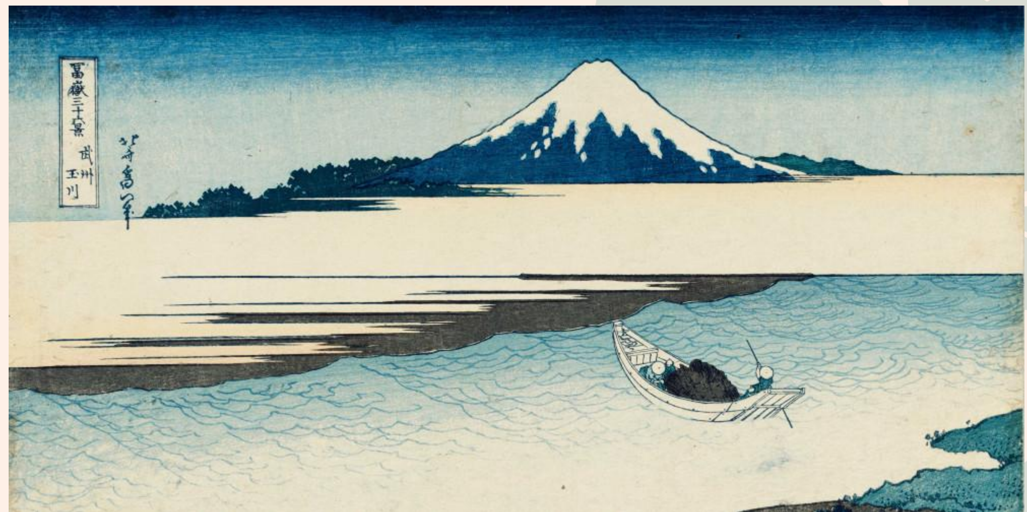
Hokusai, 36 vues du mont Fuji