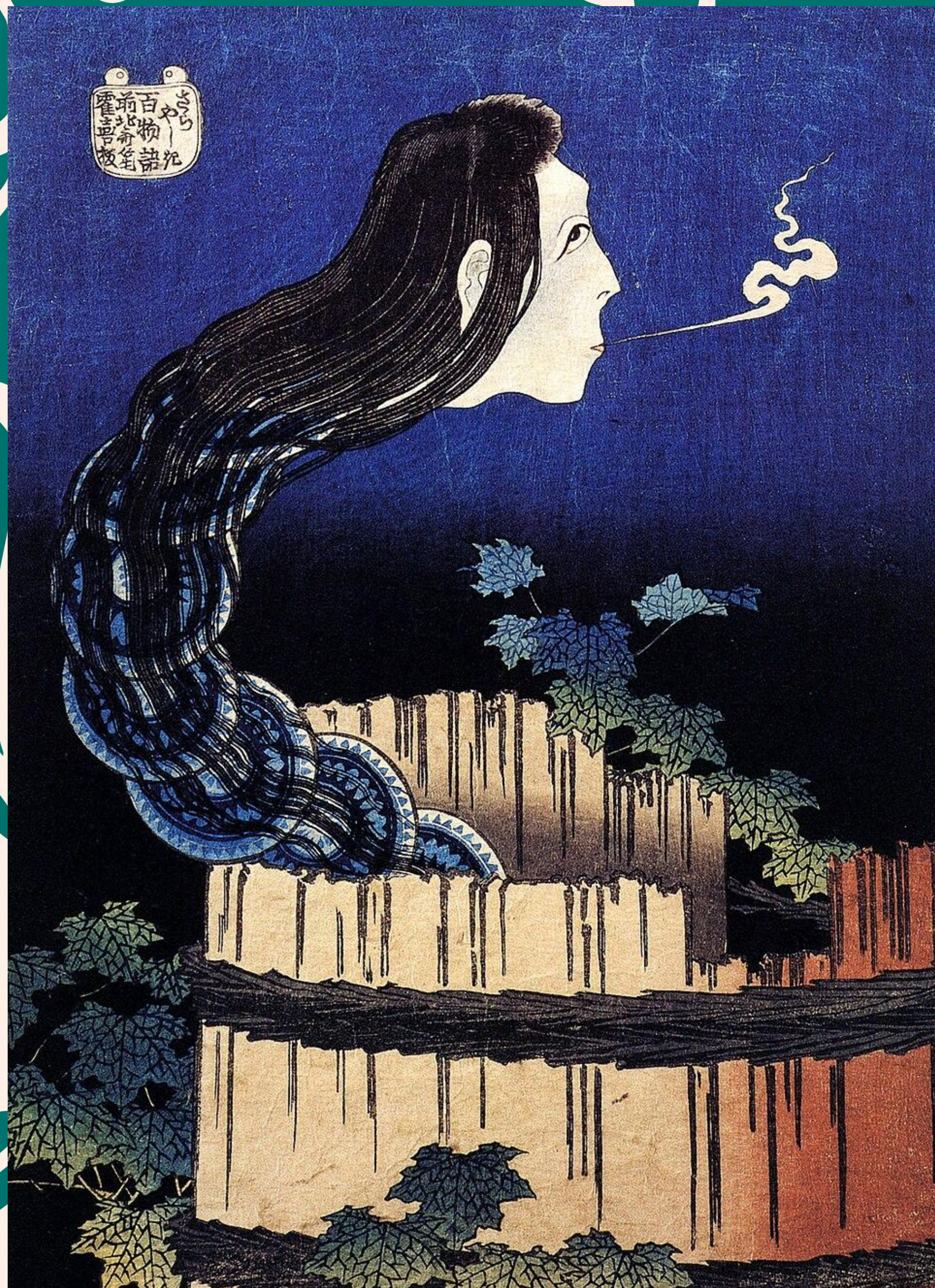
Hokusai, Femme fantôme sortant d'un puits , 1831