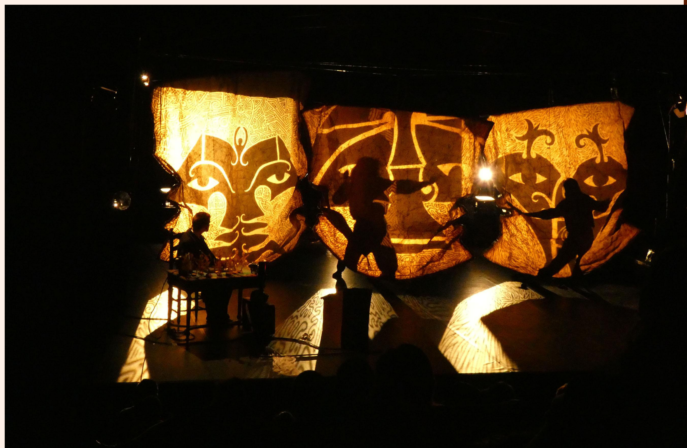
Les Derniers Géants

La compagnie Les Rémouleurs utilise couramment le papier kraft dans ses créations, comme ici, dans le spectacle Les Derniers Géants .